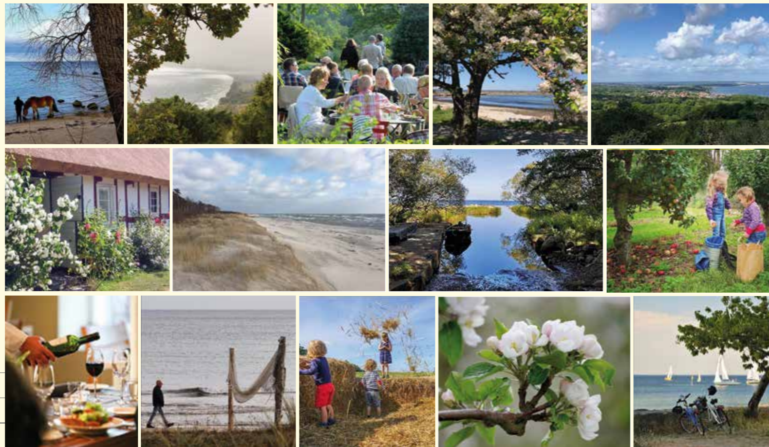
Flera av bilderna kommer från Kiviks Turisms fototävling på Instagram. Alla bilder är tagna i de vackra, lokala omgivningarna runt Kivik.